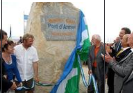
Inauguration du port : 2 juillet 2009