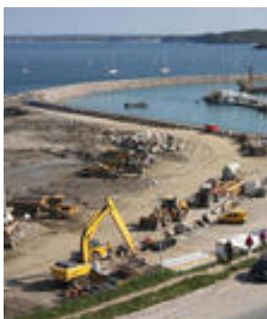
Vue d'ensemble - Mai 2009