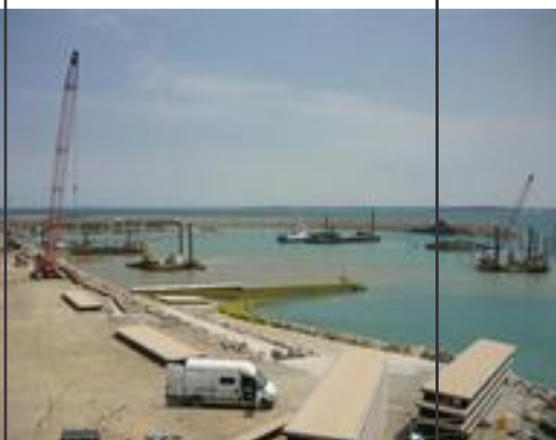
Vue d'ensemble du port