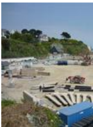
Assemblage des catways