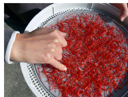
Filaments de Safran après émondage